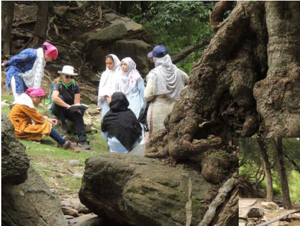
CONDURRE UN GRUPPO