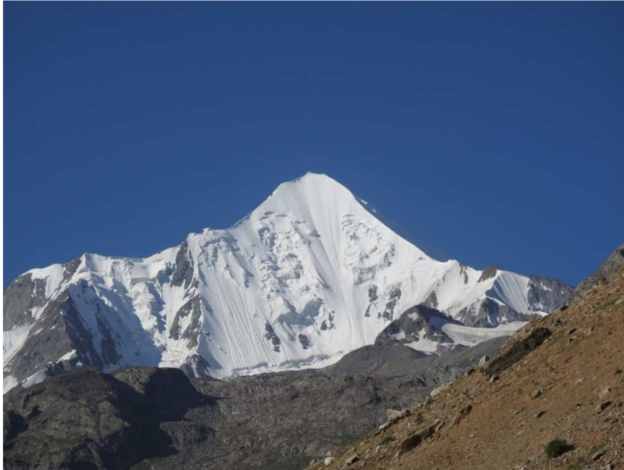
Falak Sar (vista da Kalam)