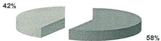
ISCRITTI CASSA - ANNO 2011