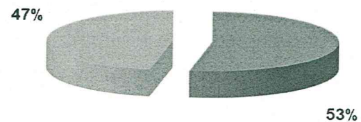
ISCRITTI CASSA - ANNO 2023