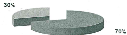
ISCRITTI CASSA - ANNO 2001