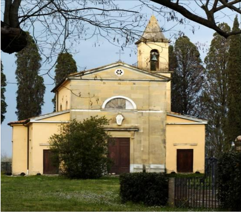
Cappella Gentilizia della Villa Carmignani a Collesalvetti - Livorno (proprietà Cassa Forense)