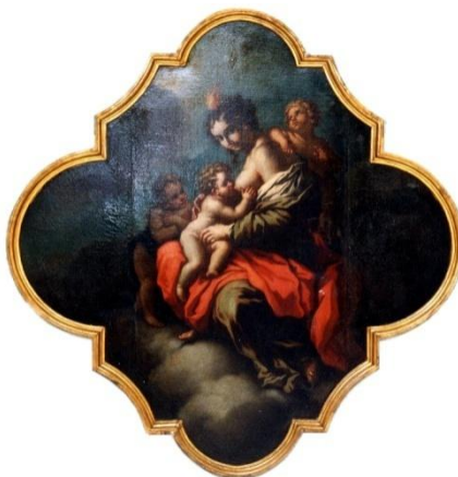
Dipinto ad olio raffigurante Madonna con Bambino e S. Giovanni - F. Giordano - sec. XVII-XVIII (Proprietà Cassa Forense)

La domanda deve essere presentata, a pena di decadenza, a decorrere dal compimento del sesto mese di gravidanza (26esima settimana di gestazione) fino al termine perentorio di 180 giorni dal parto.